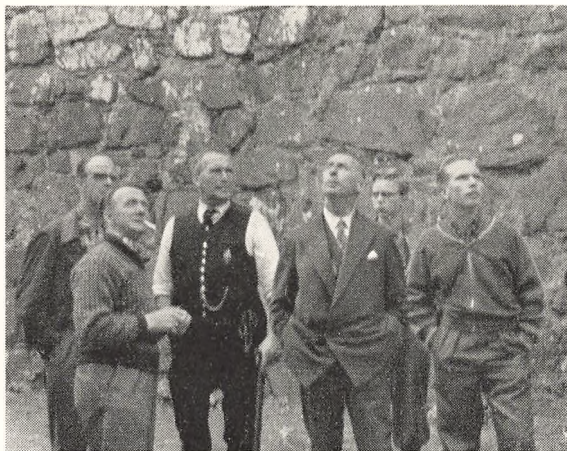
Kongsbonden i Kirkjubo fortæller om domkirke- ruinen

og Lille Dimon. Først besøgte Tværrå. De udholdende gik, de andre kørte op til kulbruddet vest for byen. I 300 m's højde fører en 600 m lang minegang ind til stedet, hvor kullene efter en forsprængning brydes på gammeldags vis. Lagene er 80 cm tykke med mellemliggende sandsten; glanskullene er af god kvalitet. — Om eftermiddagen sejlede vi videre sydpå til Våg. Her gav kommunestyret om aftenen gratis biltur op til Loranstationen, hvorfra flyvning og sejlads i Nordatlanten dirigeres. Heroppe og på turen ned over ejdet, det smalle sted, hvor Vågfjorden fra øst næsten mødes med havet i vest, oplevede vi den mest vilde og forrevne