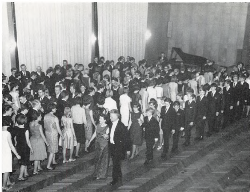
Skoleballet begynder med indmarch, anført af rektor og frue.