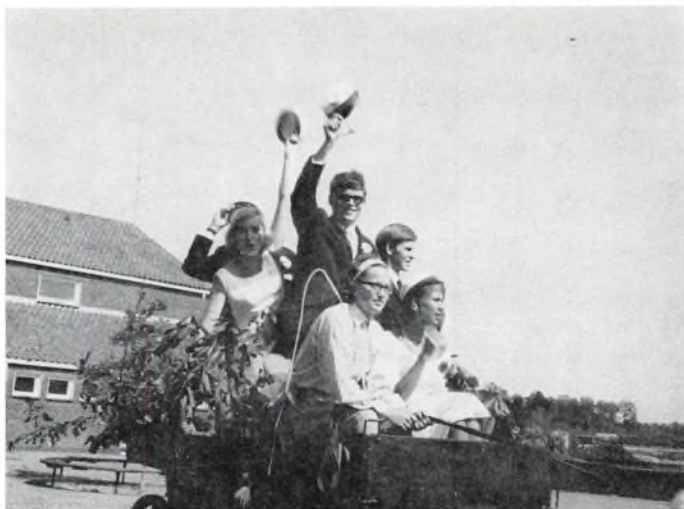
Den sidste — og mindste — studentervogn kører fra skolen (1964)