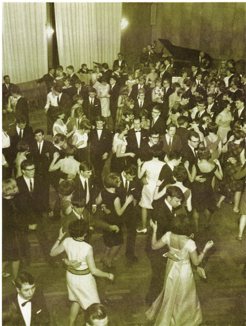
Fra skoleballet 1966.