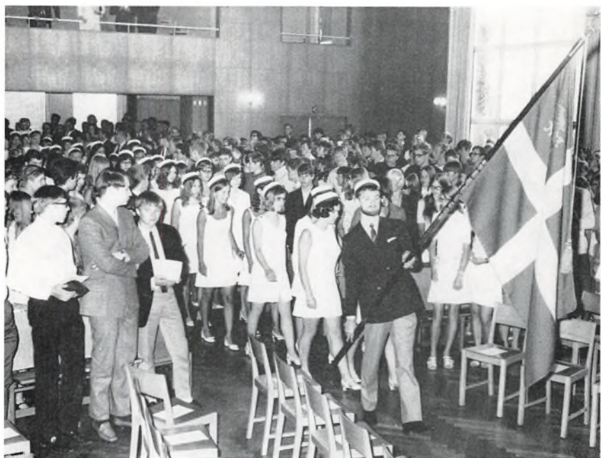
Fra dimissionsfesten. Studenterne kommer ind til tonerne af Johan Svendsens festpolonaise.