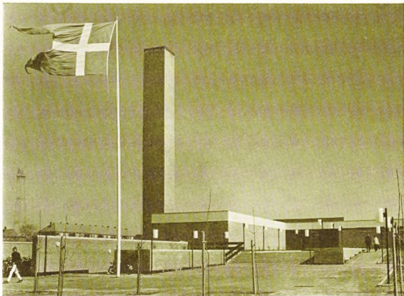
Roskilde Katedralskole, hovedindgangen.