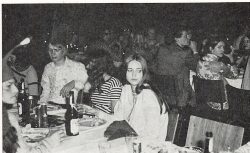
Glimt fra Hroars julesold, hvor der var fyldt ved salens veldækkede borde — og høj humor aftenen igennem.

som fandt sted den 15., var meget hektiske. Der skulle bestilles vin, øl, sodavand, duge, gran og meget mere, samt laves dekorationer, til hvilket formål vi måtte alliere os med en lokal toiletrullefabrikant. Skolens store festsal blev i løbet af dagen forsynet med borde, som blev pyntet efter alle kunstens regler. Alt forløb efter planen, og da maden ankom kl. 18,15 tillige med et feltkøkken på størrelse med et asfaltkøgeri, åndede bestyrelsen lettet op, hvorefter vi delte en kop øl, inden vi sammen med det meste af den øvrige skole gik til bords halv syv. Menuen bestod af: Helstegt svinekam med svesker, samt alt andet tilbehør såsom brune kartofler, franske ditto, surt, sødt og andet godt. — 1/2 flaske rødvin pr. couvert. — 1 stk. nissehue (til at anbringe på hovedet).