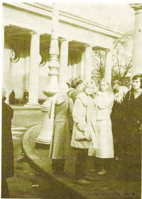
Fra 3 ay's tur til Leningrad.

Hotellet, vi bor på, er bygget af unge for unge. Det hedder Druschba og det betyder venskab. En aften sidder vi alle sammen på et af værelserne og drikker vodka eller russisk