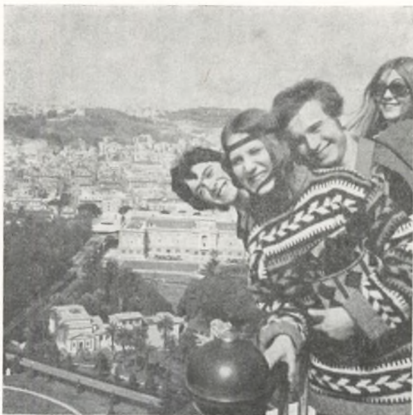
Fra 2 nsa's tur til Rom.