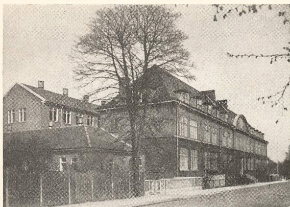
Skolen set fra Skolevej