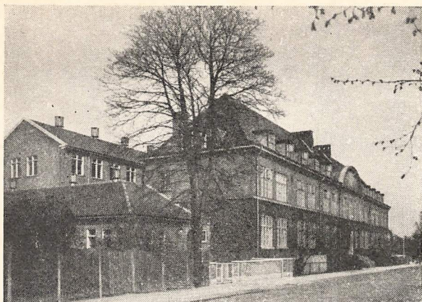
Skolen set fra Skolevej