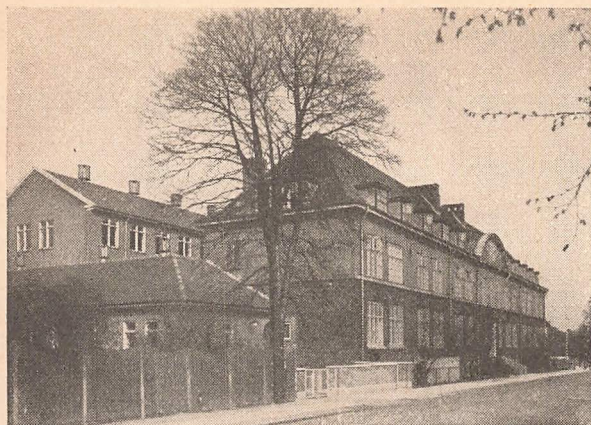
Skolen set fra Skolevej