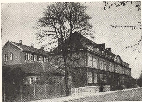
Skolen set fra Skolevej