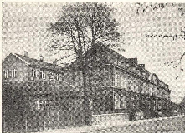
Skolen set fra Skolevej