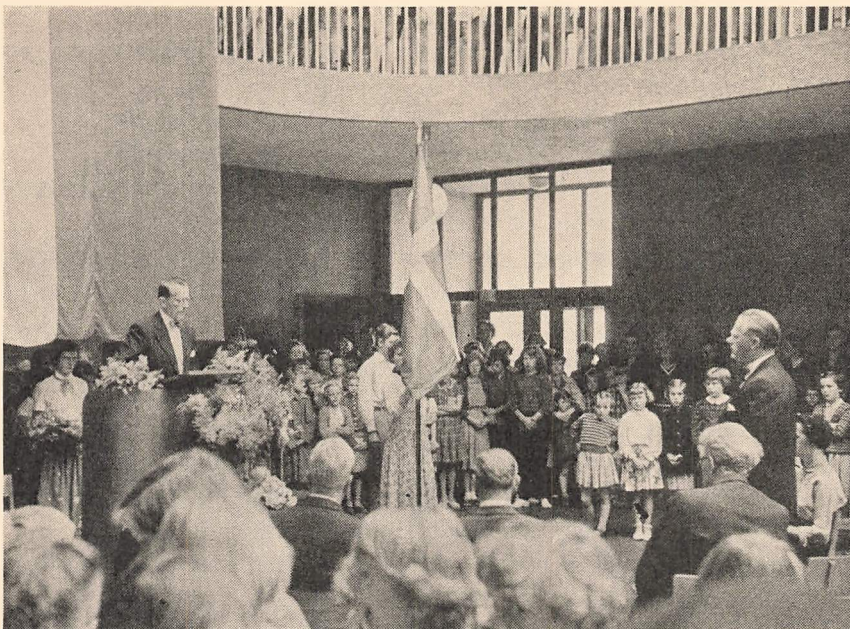
Den ny inspektør indsættes. — Skoledirektøren taler.