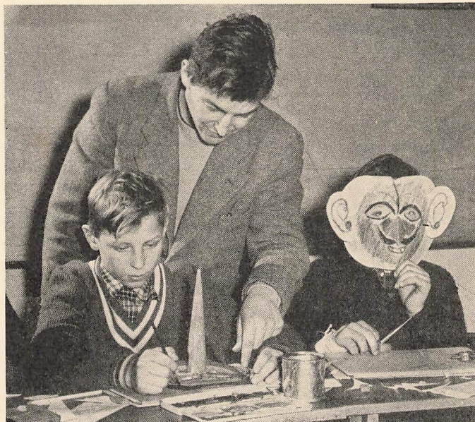
Frie øvelser — der laves fastelavnsmasker.