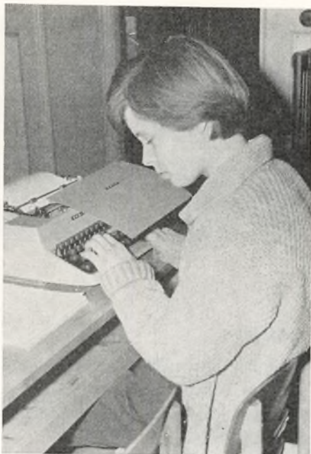
Skolen har fået 24 nye skrivemaskiner.

vold skole, medens godt 80 fortsatte her på skolen fordelt i 3 klasser. At så få elever kom i 8. klasse teknisk linie, skyldes den omstændighed, at der stilles meget store krav til disse elever, både hvad evner og flid angår. Grunden til, at eleverne ikke er kommet i realafdelingen i stedet, er den, at skolen ikke har ment, at de ville kunne tilfredsstille kravene, man der stiller i sproglig retning.