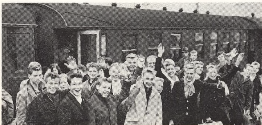
Amagerbro håndbold-drenge ankommer til Odense.

I Odense tilbragte drengene nogle dejlige dage sammen med børn fra alle egne af landet – med udflugter til Sydfyn og Taasinge og med kammeratligt