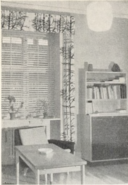
— et hjørne af kontoret.

vender de padauk-træ, formodentlig det fineste, der grønnes og blomstrer i Afrikas urskove. — Skabenes hylde kan tages ud og anbringes i passende afstande efter præparaternes højde. — I juleferien blev vægge og døre i de to