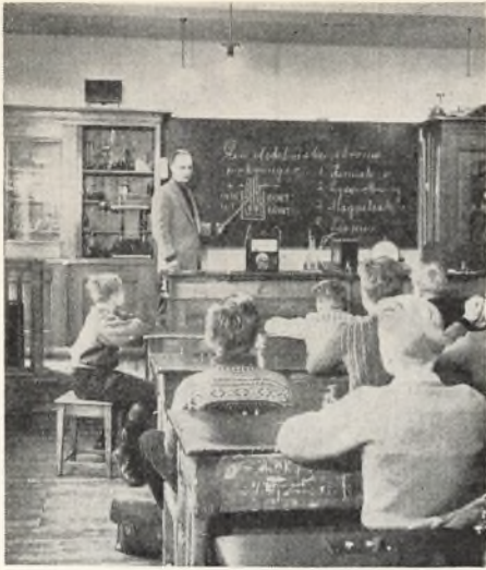
— det gamle fysiklokale.

men desværre i for stor afstand fra demonstrationsbordet.