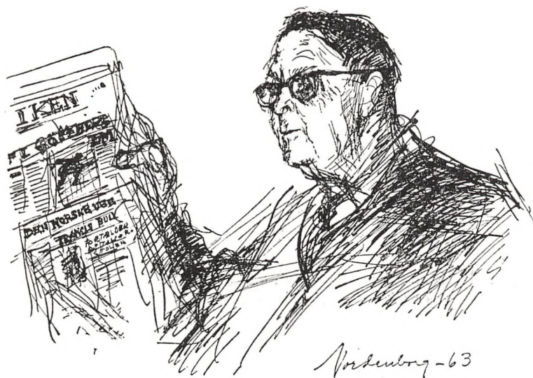
Professor Francis Bull var skolens gæst d. 5. februar.

13. februar: Erhvervsvejledning på skolen for IIIg og IIg.