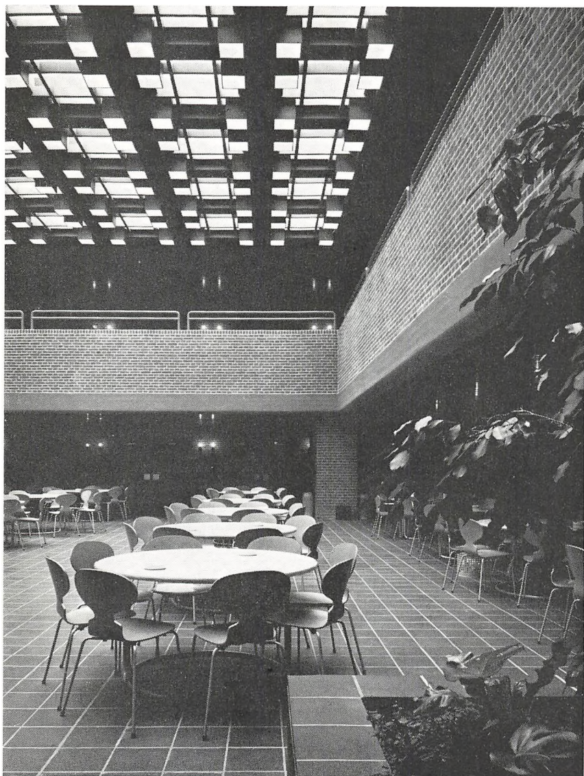
Struer Statsgymnasiums årsskrift 1974