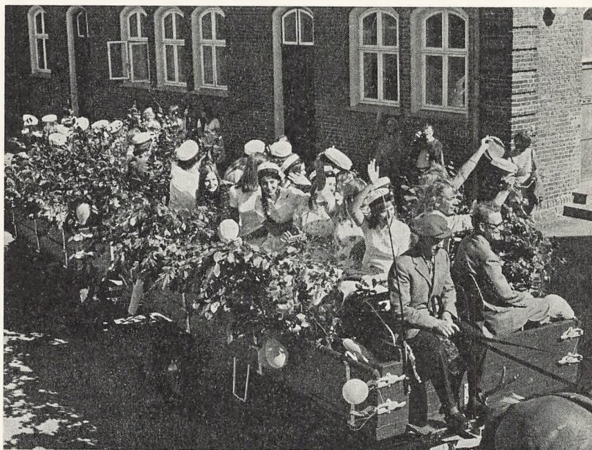
Studenterne kører bort 20. juni 1973