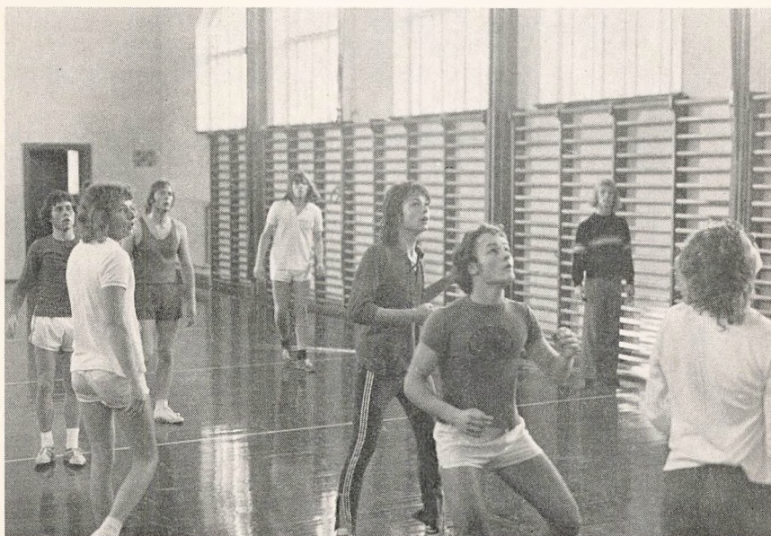
Fra klasse-turneringen i basketball.