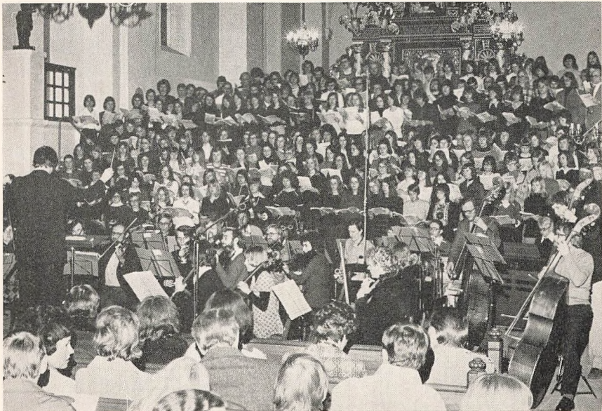
Forårskoncert i Maribo Domkirke d. 13. april