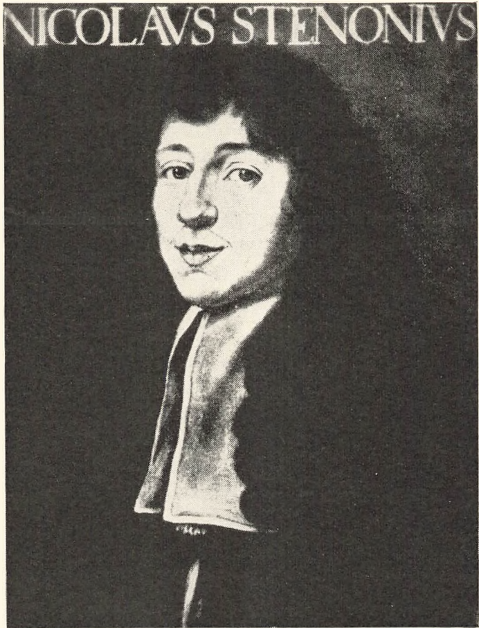
Ungdomsbillede af Niels Steensen, malet af ukendt mester. (Palazzo degli Uffizi, Firenze).