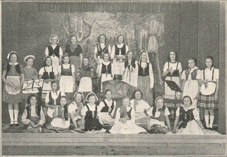
Deltagerne i Haydn's Børnesymfoni.

Besøg med III M. A. og B. paa Rosenborg.