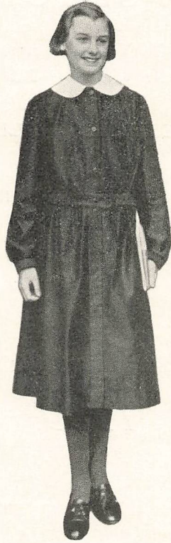
SKOLEUNIFORMEN, sort Kittel med hvid Krave.

Alle Elever skal bære en bestemt Skolekittel. Model kan ses paa Skolen. Færdigsyede Kittler haves paa Lager i Magasin du Nord, Kongens Nytorv.