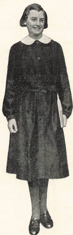
SKOLEUNIFORMEN, sort Kittel med hvid Krave.

Alle Elever skal bære en bestemt Skolekittel. Model kan ses paa Skolen. Færdigsyede Kitler haves paa Lager i Magasin du Nord, Kongens Nytorv.