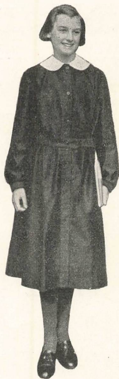
SKOLEUNIFORMEN, sort Kittel med hvid Krave.

Alle Elever skal bære en bestemt Skolekittel. Model kan ses paa Skolen. Færdigsyede Kitter haves paa Lager i Magasin du Nord, Kongens Nytorv.