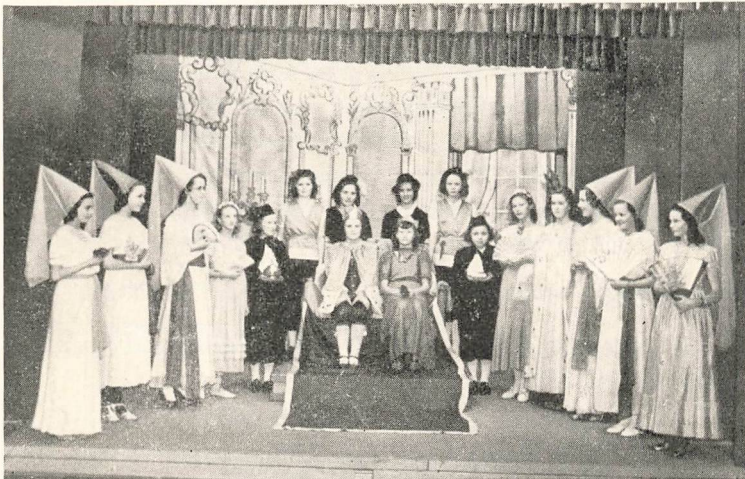
»King Cophetua and the Beggar Maid«.

De ekstraordinære Forhold i dette Skoleaar har bevirket, at Skolen ikke har kunnet gennemføre sine Ekskursioner i sædvanligt Omfang. — Den aarlige Skovtur og Besøg paa forskellige industrielle Virksomheder og Museer er dog blevet gennemført. — I November opførte Skolens Elever C. Hostrups Sangspil: »Mester og Lærling«, der tre Aftener samlede fuldt Hus. — I Marts havde Mellemkoleklasserne og Realklassen arrangeret »Broget Aften«, en lille Aftenunderholdning med Sang, Musik og Komediespil paa de forskellige Sprog.