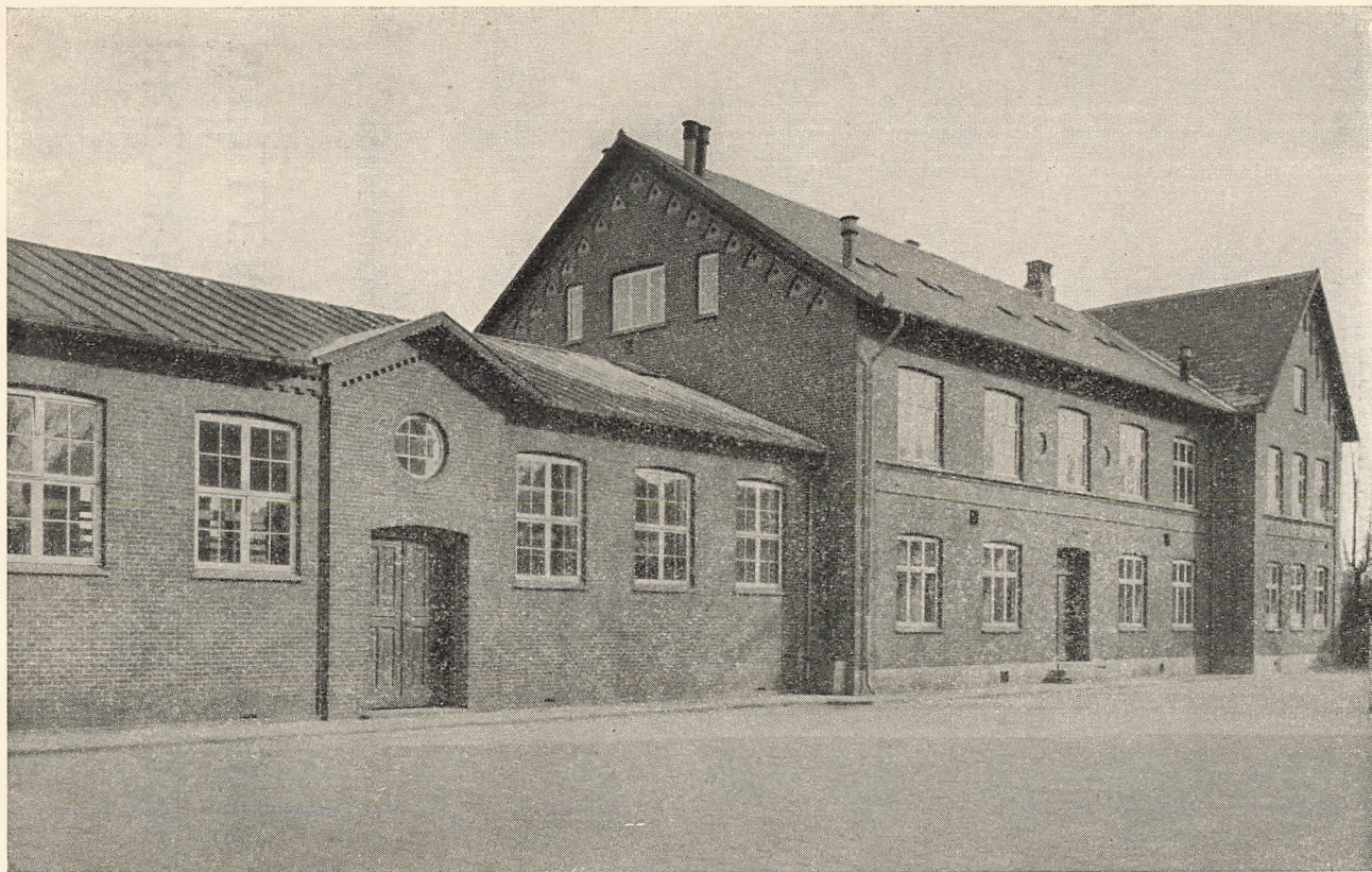
Frederikssund private mellem- og realskole.