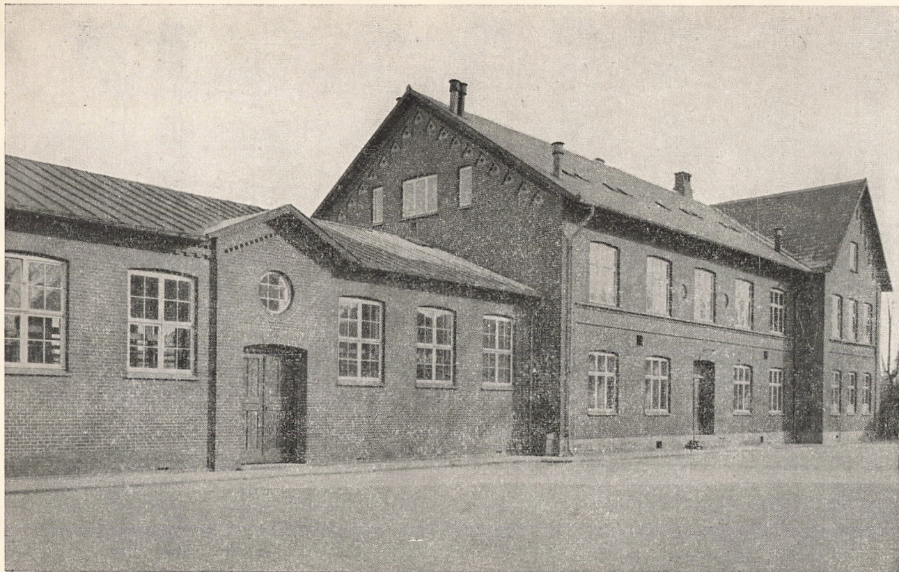
Frederikssund private mellem- og realskole