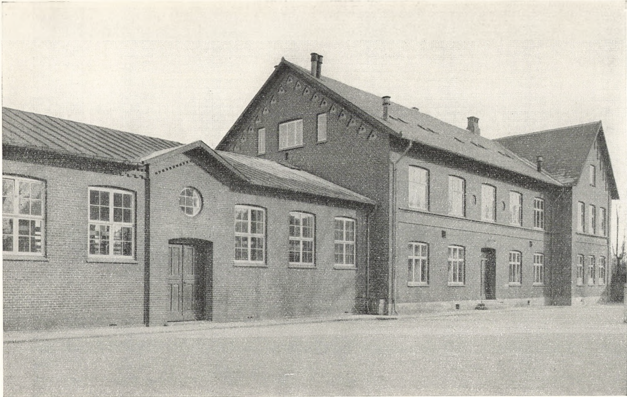
Frederikssund private mellem- og realskole.