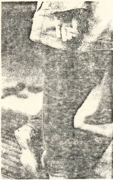
Cigaretrykning i smug — en saga blott?