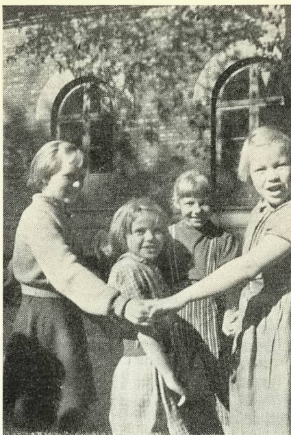
Leg i skolegården.

Det er vort store ønske engang selv at få en scene, og vi håber, at skolens forældre-kreds vil være os behjælpelig, når vi frem i tiden ved papirindsamling, film-aftener etc. prøver på at skrabe penge sammen for at blive selvejende.