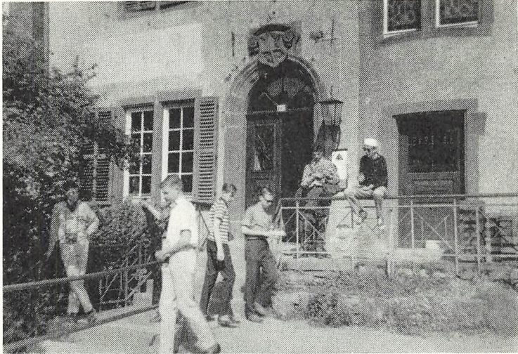
Vandrehjem i Bernkastel ved Mosel.