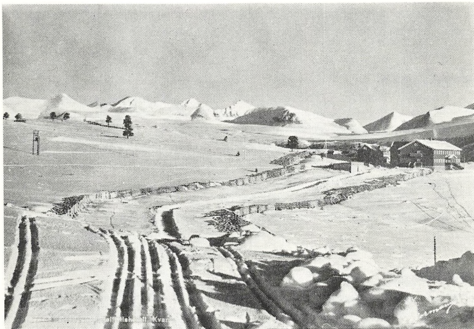
Rondablikk Høifjeldshotell, Kvam, Norge, hvor 10 elever fra skolen boede under Norges-rejsen 29. januar til 10. februar.