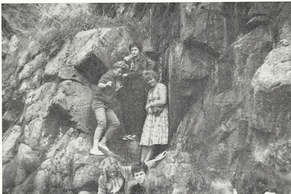
Modet med Bornholms klipper er i sig selv en oplevelse, men raske skolepiger vil naturligvis forsøge en klatretur — og den forløb godt. Vi ser 5 piger fra Nansensgades skole under et hvil i klatreturen ved Johns kapel.