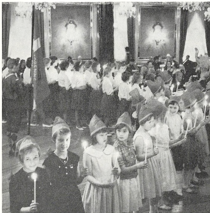
Ved den store julemaliné på Wivex medvirkede pigerne fra 4 u i et smukt og stemningsfuldt optrin.