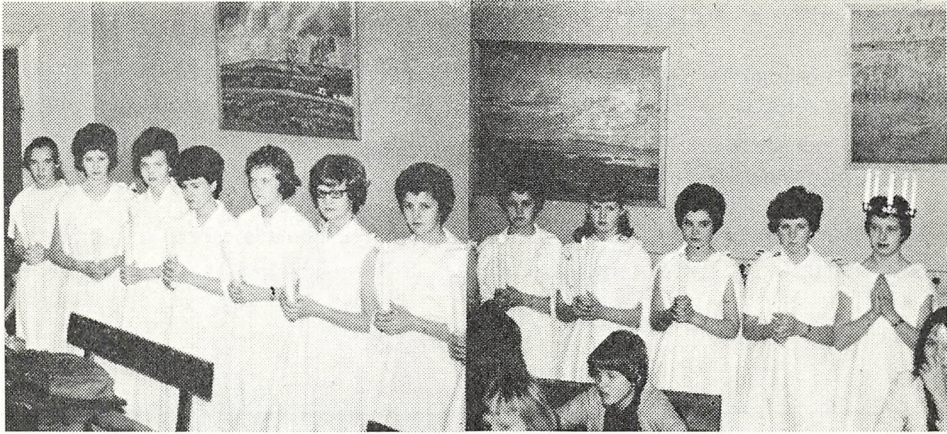
Til Lucia-dagen valgte pigerne Luciabruden og gik en tur gennem alle klasserne, syngende Lucia-sangen.

Onsdag den 13. decbr. gik de store piger fra 1 ru i Lucia-optog, og elever fra 1. klasser uddelte Lucia-kager til hver elev. De små havde nissehuer på og røde bluser.