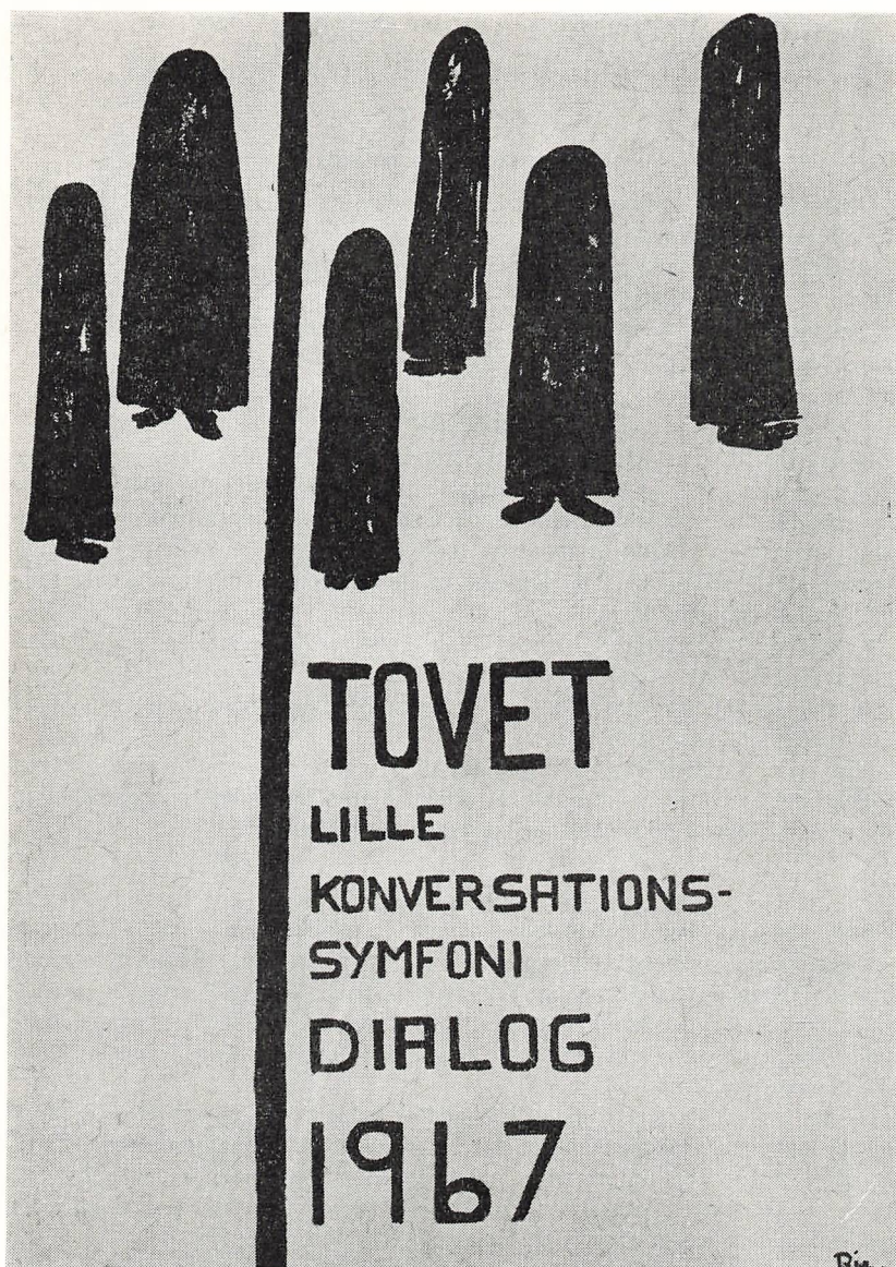
Vinderplakaten ved konkurrencen i forbindelse med skolekomedien.