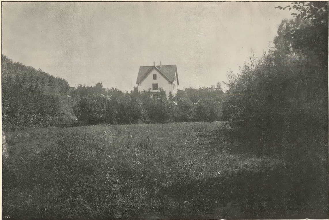
FRA SKOLENS ENG