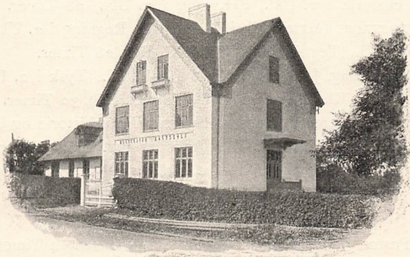
SKOLEBYGNINGEN FRA HJØRNET.