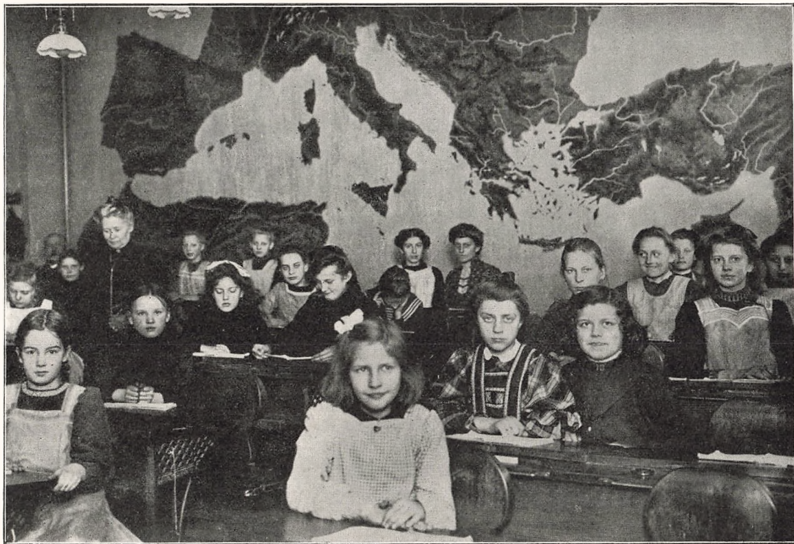
Middelhavskortet i 4de Klasse.