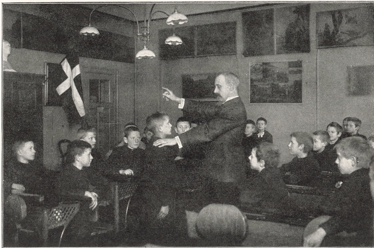
Der er Fødselsdag i Klassen.