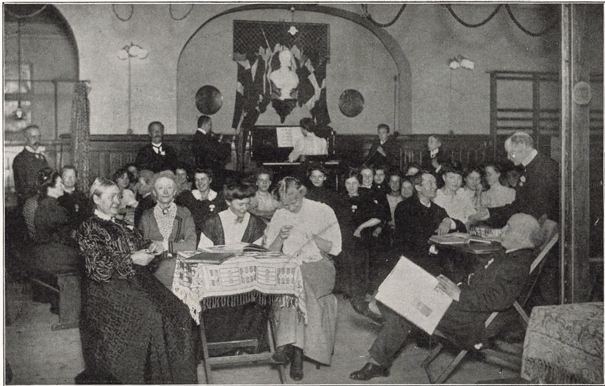
Musikaften i „det kgl. Vajsenhus's Ungdomsforening“.