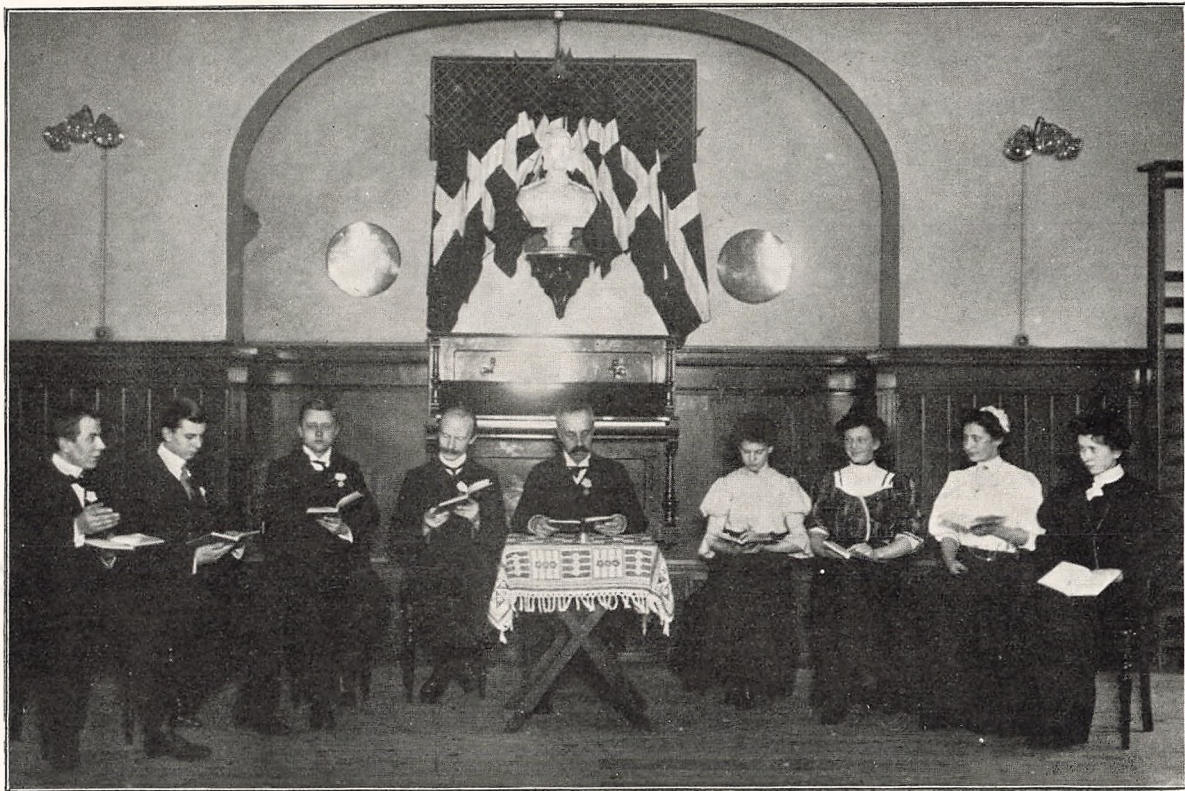
De oplæsede ved Aftensammenkomsterne.