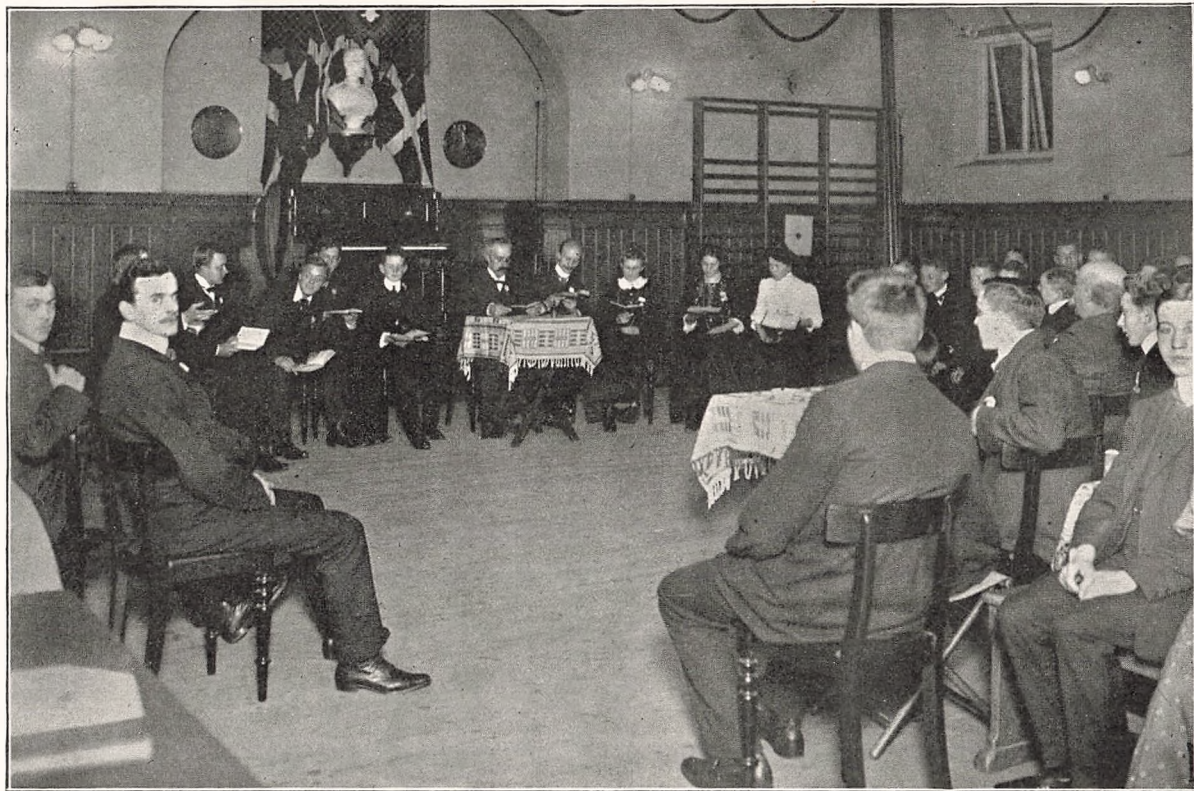
Oplæsning med fordelte Roller i „det kgl. Vajsenhus's Ungdomsforening“.