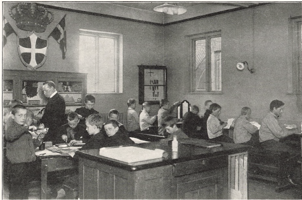
Pap- og Træsøjds skolen.