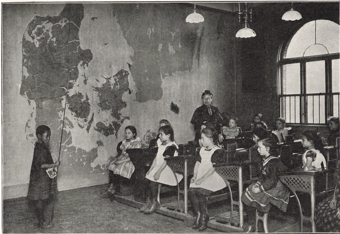
Geografiundervisning i yngste Klasse.