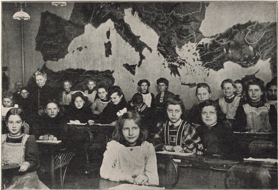
Middelhavskortet i 4de Klasse.