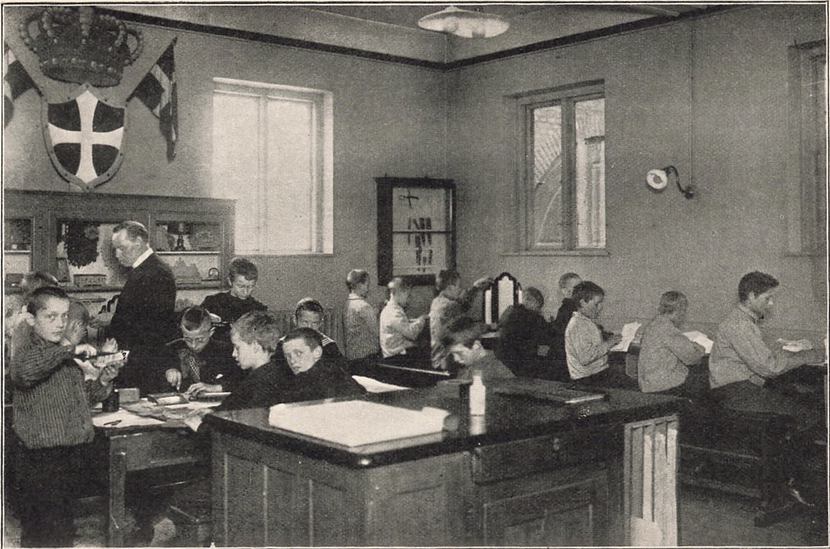
Pap- og Træsløjds skolen.