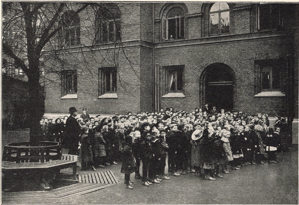
Klokken ringer til Opgang.