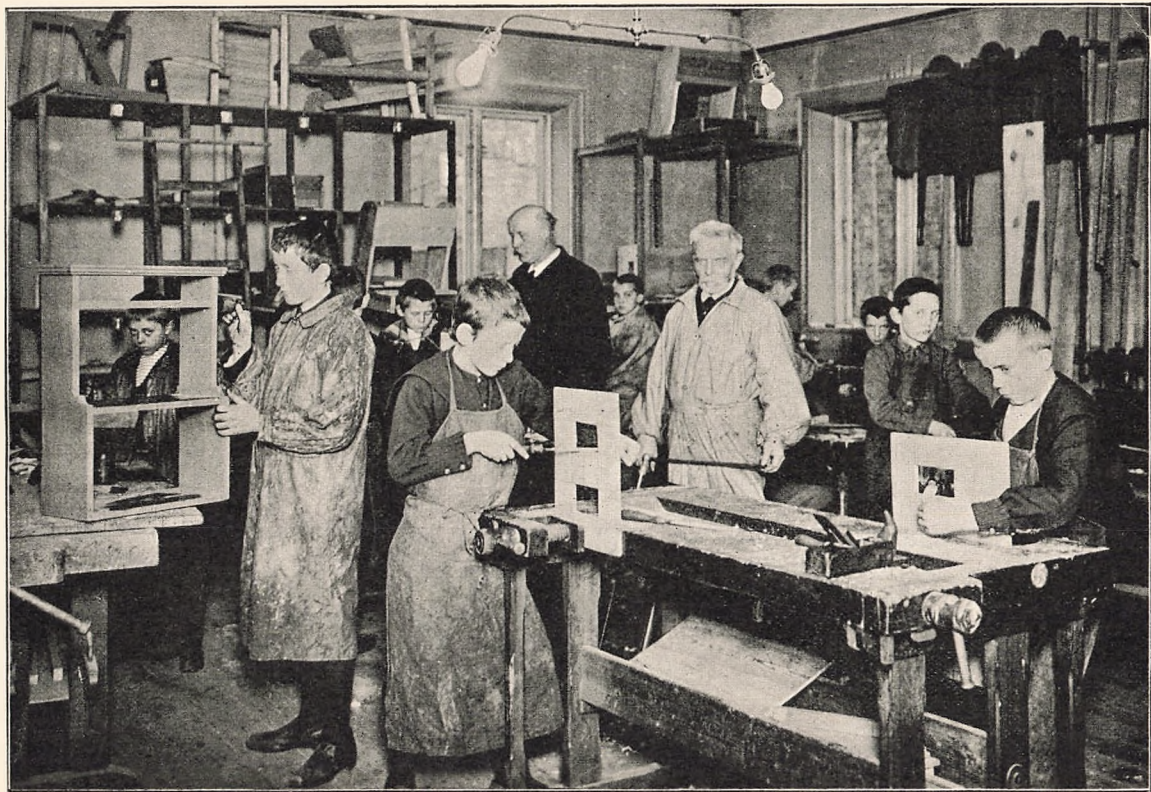
Snedker- og Drejerskolen.