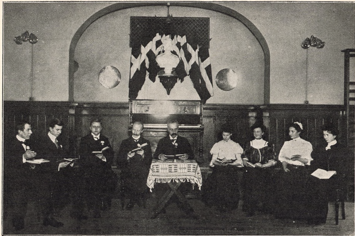
De oplæsede ved Aftensammenkomsterne.