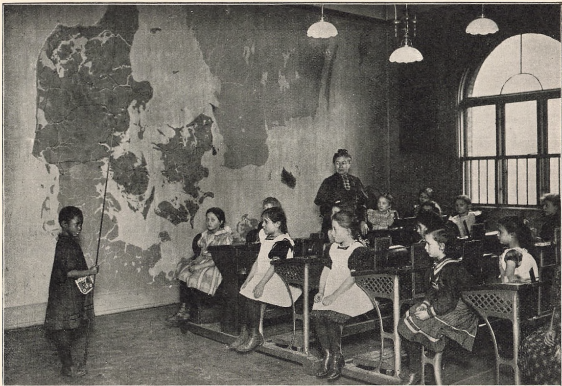
Geografiundervisning i yngste Klasse.