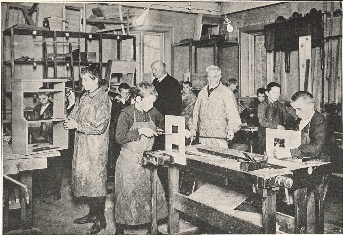
Snedker- og Drejerskolen.