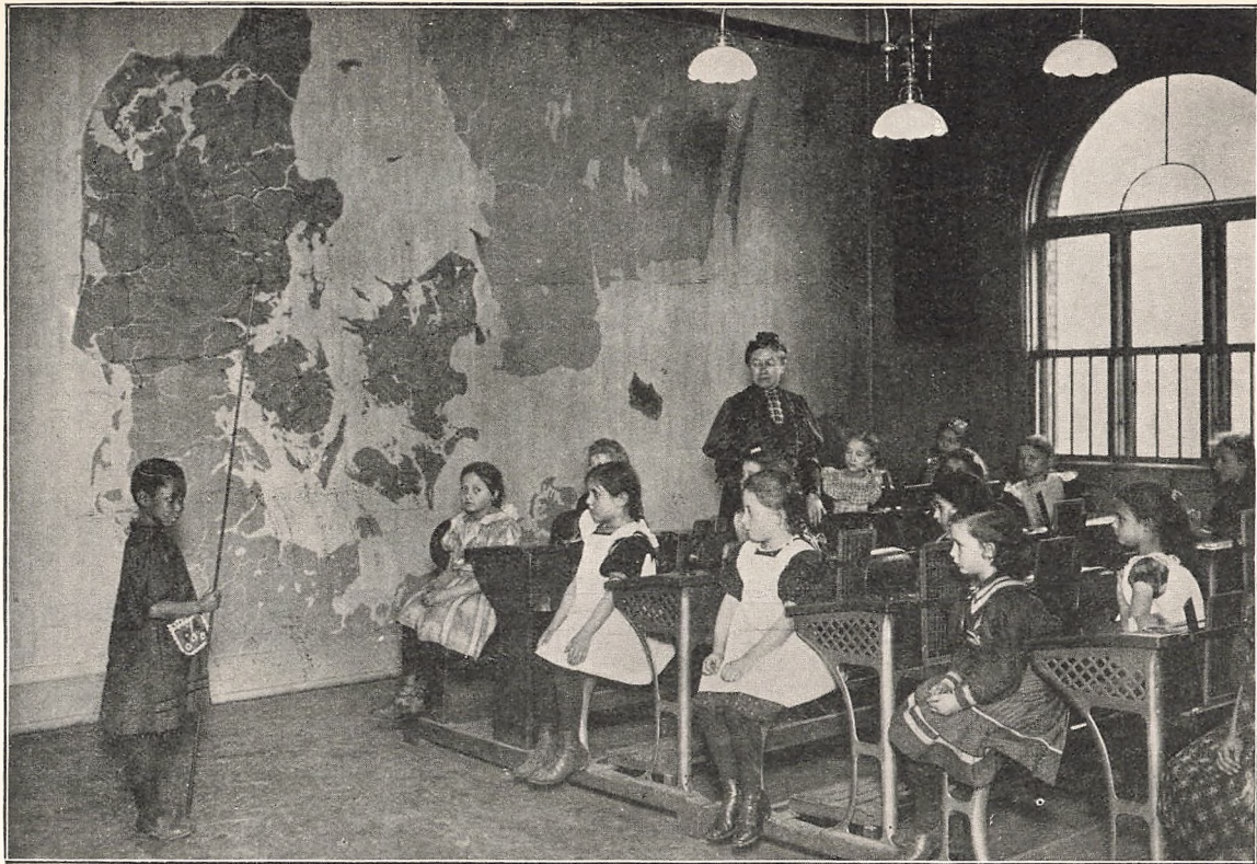
Geografiunder visning i yngste Klasse.