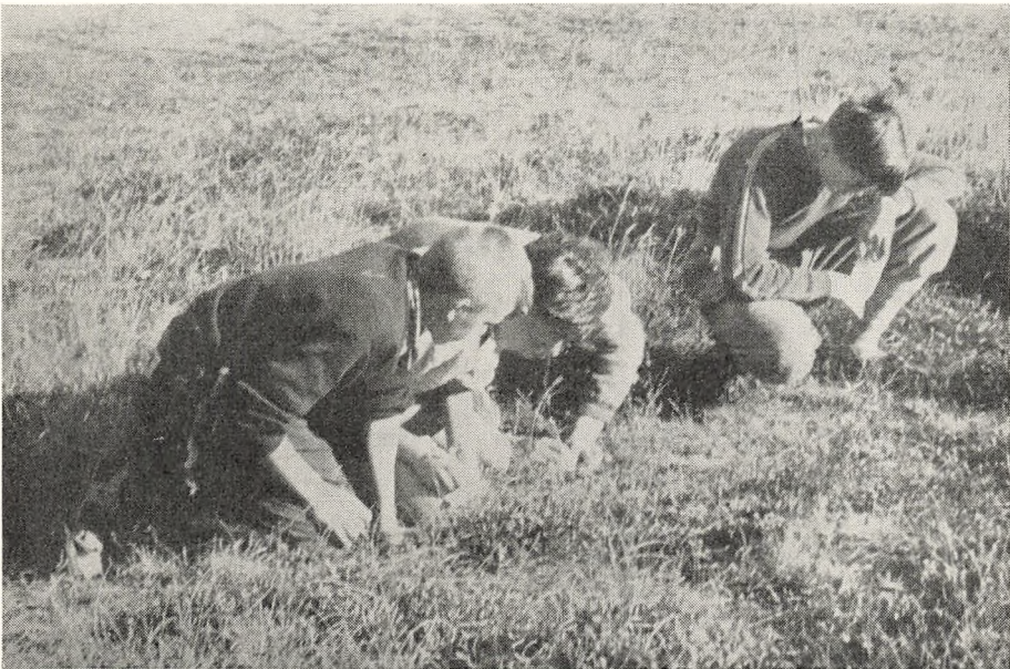
Der arbejdes i marken på lejrskole.