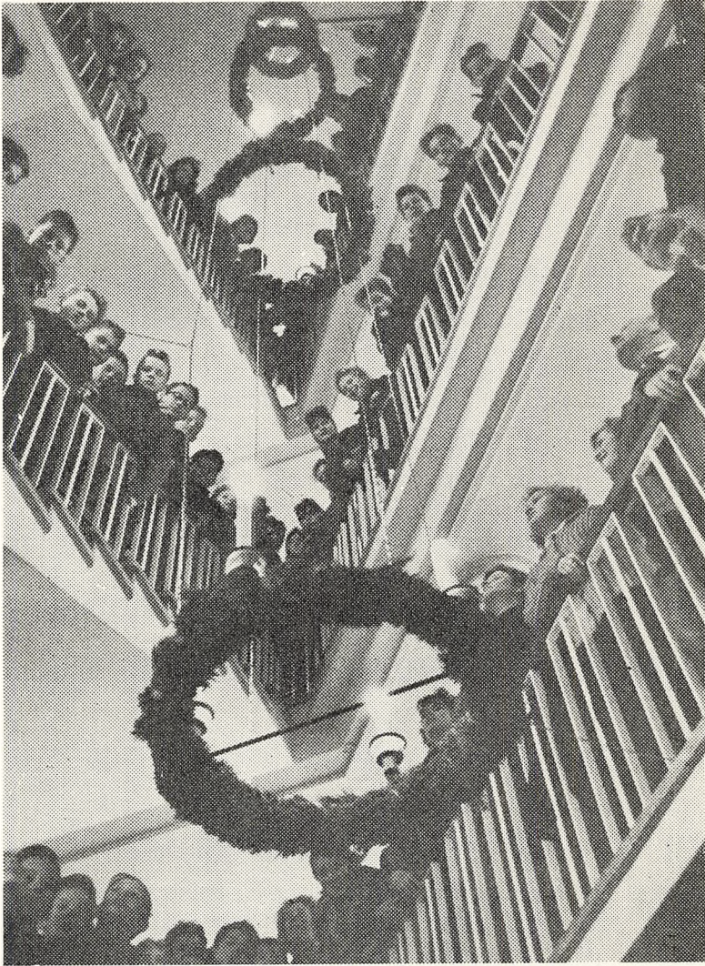
Den store, 4-delte adventskrans på hovedtrappen.