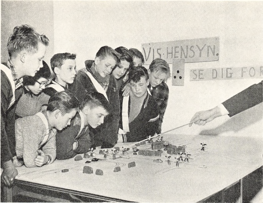
Skolepatruljerne (S.P.'erne) instrueres i deres meget vigtige job.