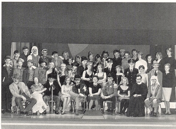
Skillingsoperaen — marts 1965.

Klasseforældremøderne indledtes med en kort orienterende indledning ved rektor. Herefter drøftedes spørgsmål vedrørende de pågældende klasser og skolen som helhed, og til slut havde forældrene lejlighed til samtaler med skolens lærere. Tilslutningen til alle møder var særdeles god.