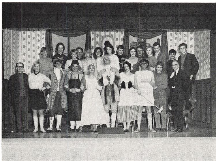
Kierlighed uden Strømper – februar 1968.