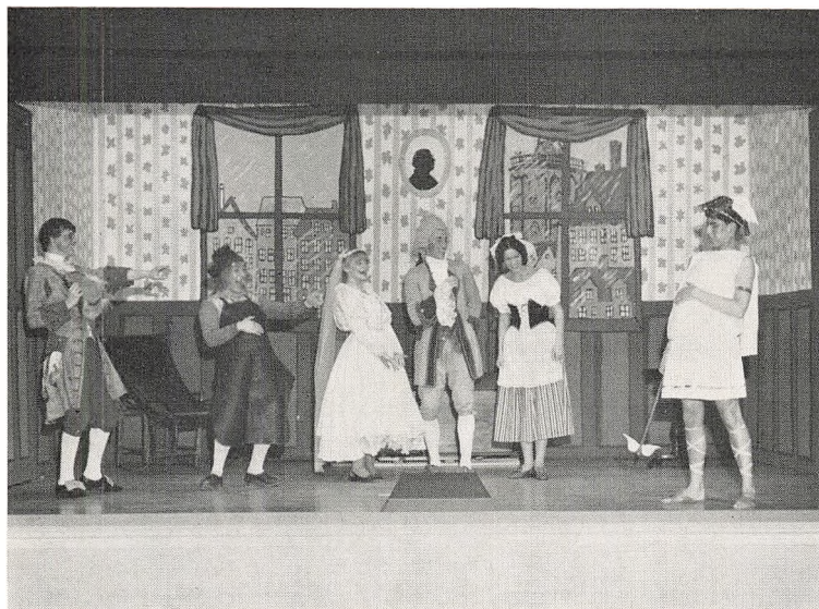
Kierlighed uden Strømper – februar 1968.

uden har salen i årets løb været anvendt til koncerter og konferencer, arrangeret af A.O.F. og Kæmnerforeningen i Danmark. Også skolens frokostkælder har været anvendt til møder, bl. a. af Frederikshavn Ungdoms Fællesråd.