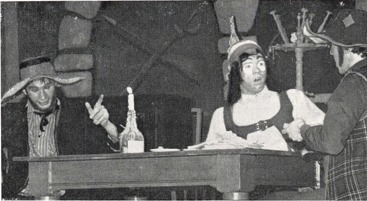
Dario Fo: Lig til salg – februar 1969.