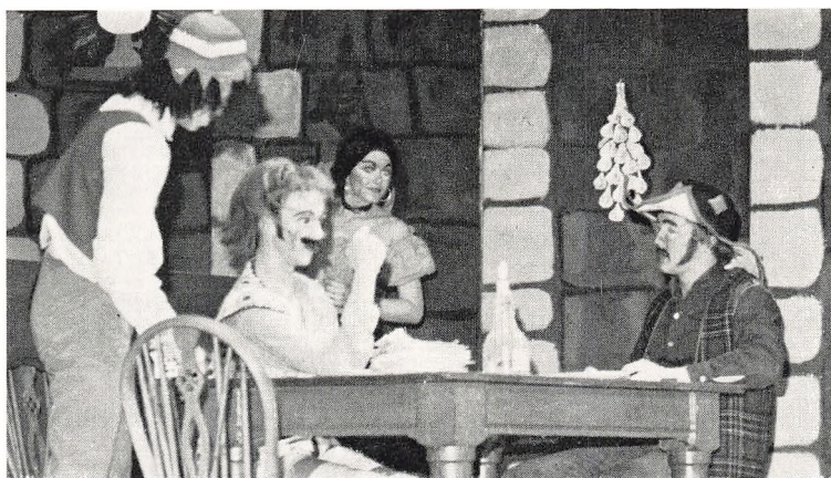
Dario Fo: Lig til salg - februar 1969.