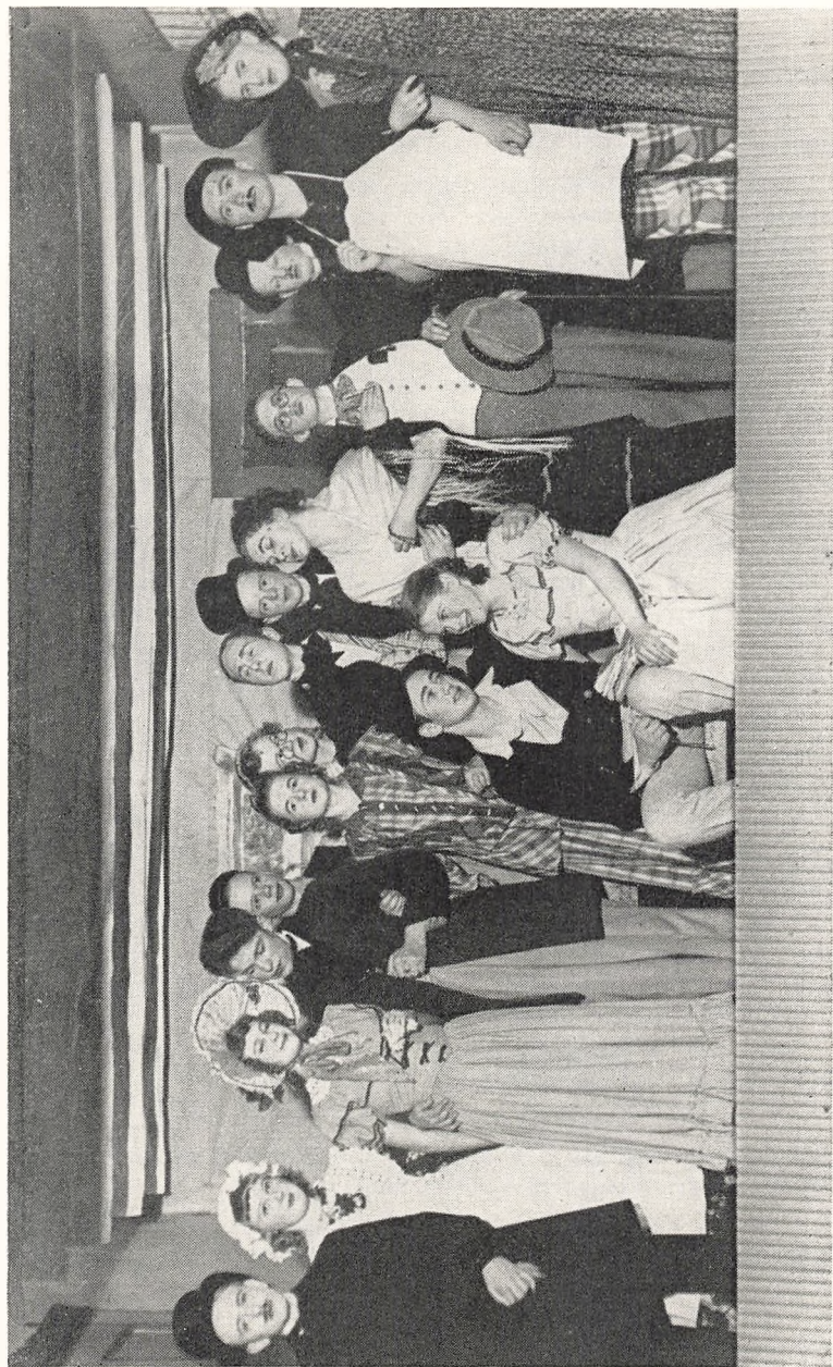
Fra opførelsen af „Aprilsnarrene“ marts 1949