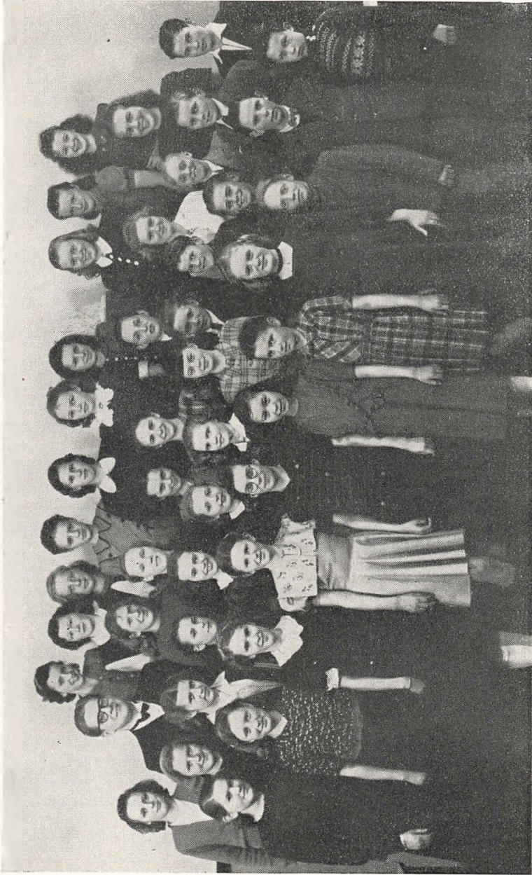
Fra elevkoncerten den 7. april 1949