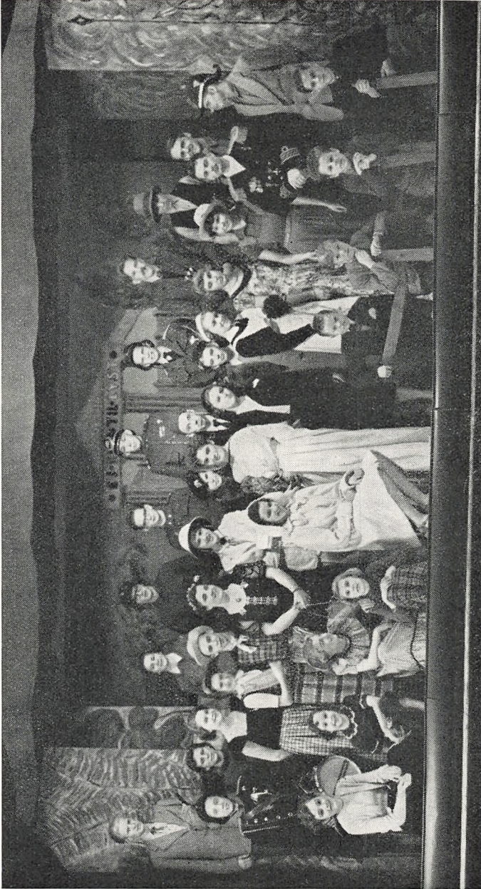
Fra opførelsen af »Olysses von Ithacia« marts 1951