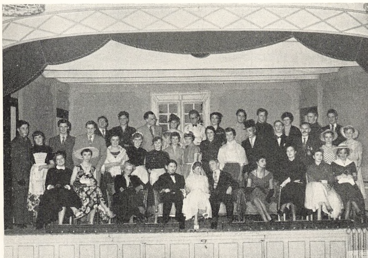
»Eventyret« — Marts 1955