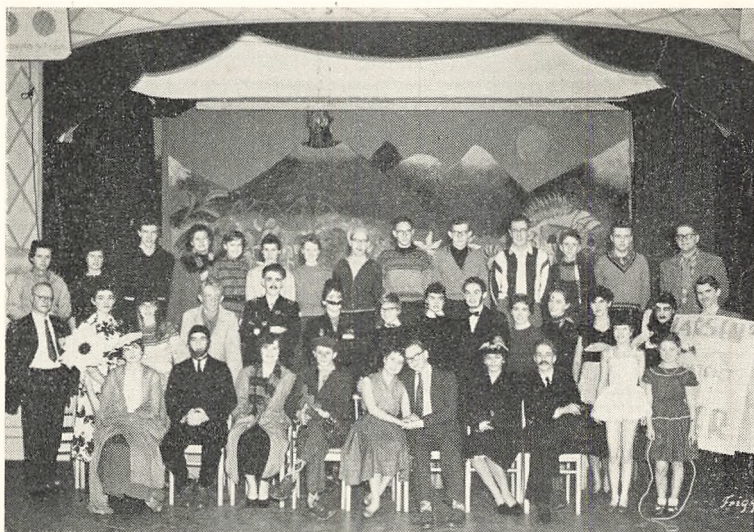
KJELD ABELL: »MELODIEN, DER BLEV VÆK« MARTS 1956