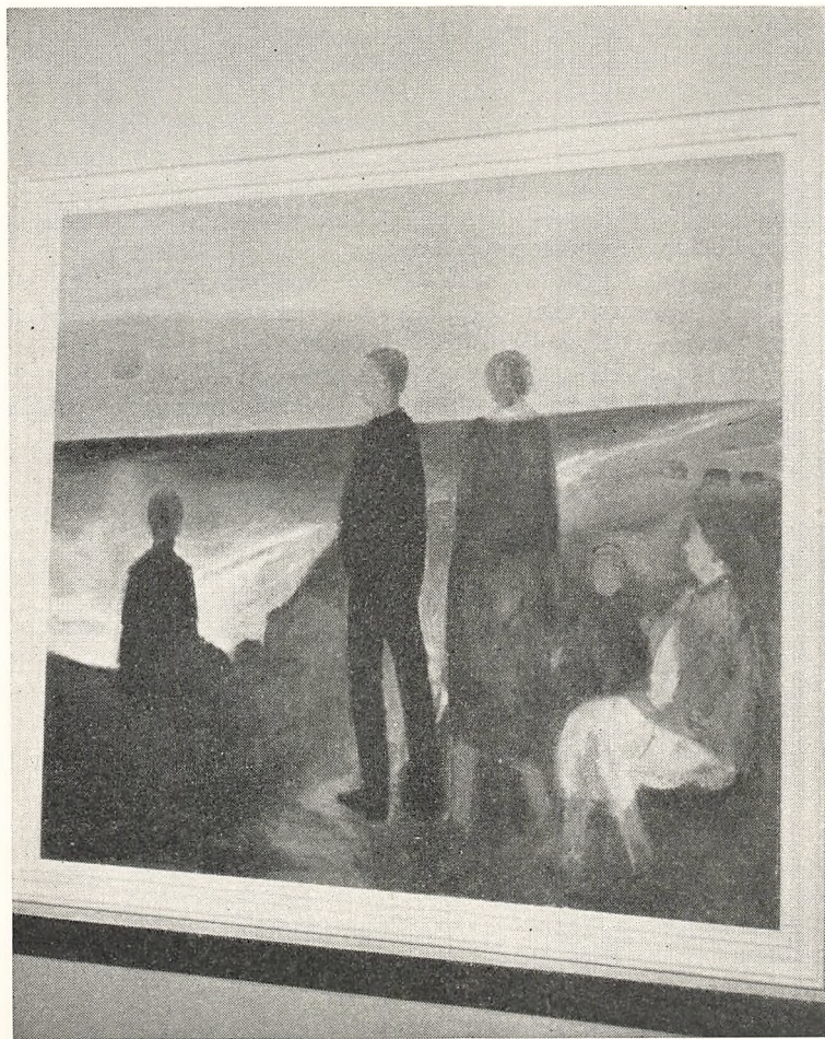
JENS SØNDERGAARD: MENNESKER VED HAVET, 1955