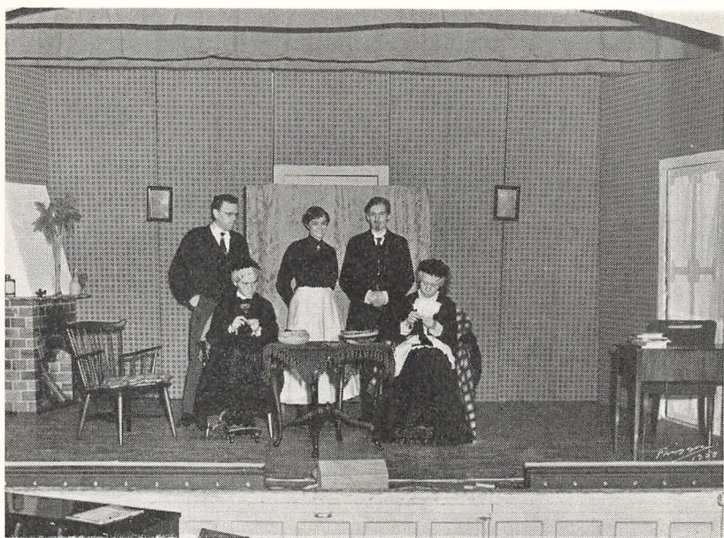
GUSTAV WIED: »SKÆRMYSLEDER« MARTS 1958

Forestillingerne på Bechs Hotel overværedes af ca. 650 mennesker, og midnatsforestillingen af ca. 525. Det samlede overskud, som udgjorde 454,32 kr., tilfalder legatforeningen.