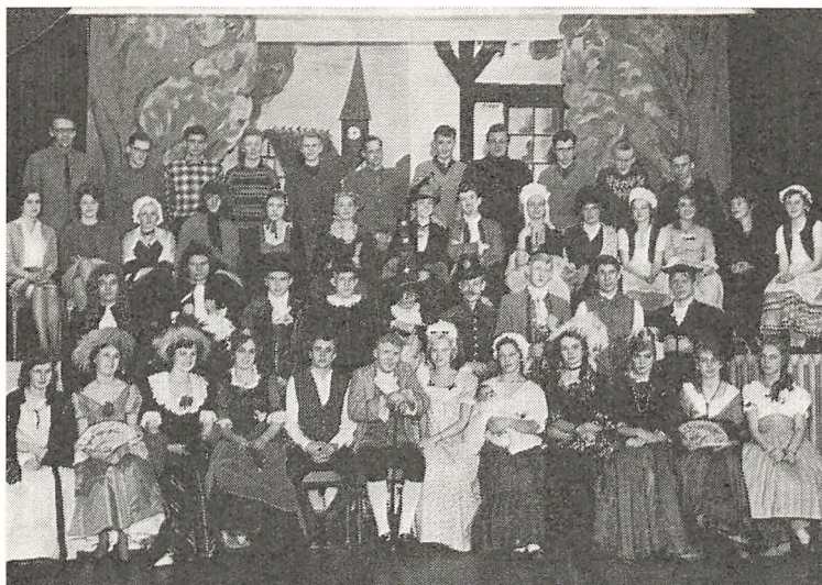
Holberg: Barselstuen. Marts 1961.

I alt deltog ca. 100 elever, og koncerten overværedes af ca. 150 tilhørere. Overskuddet ved koncerten, kr. 76,30, anvendes til indkøb af musikinstrumenter.