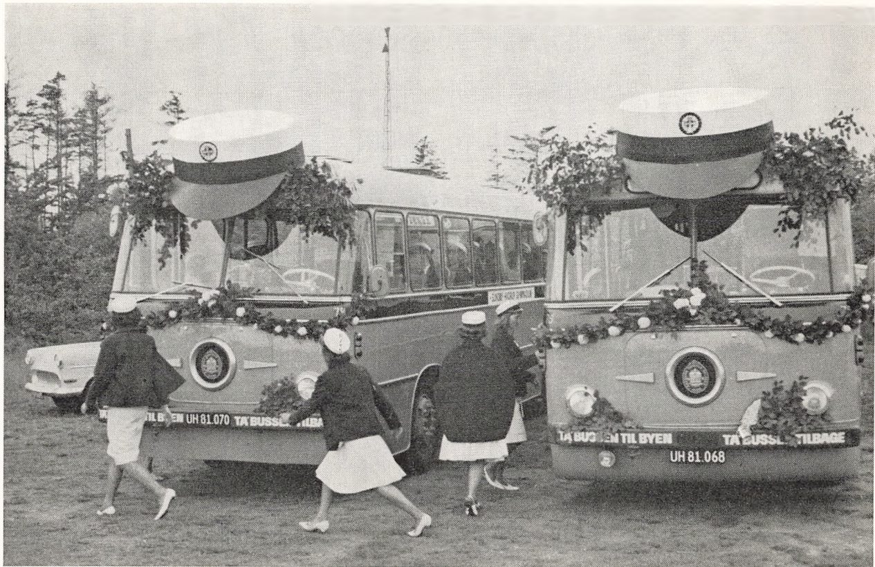
Fra studenternes køretur