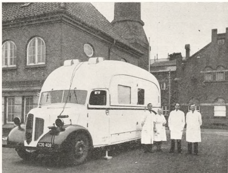
Rontgenvognen i Nakskov