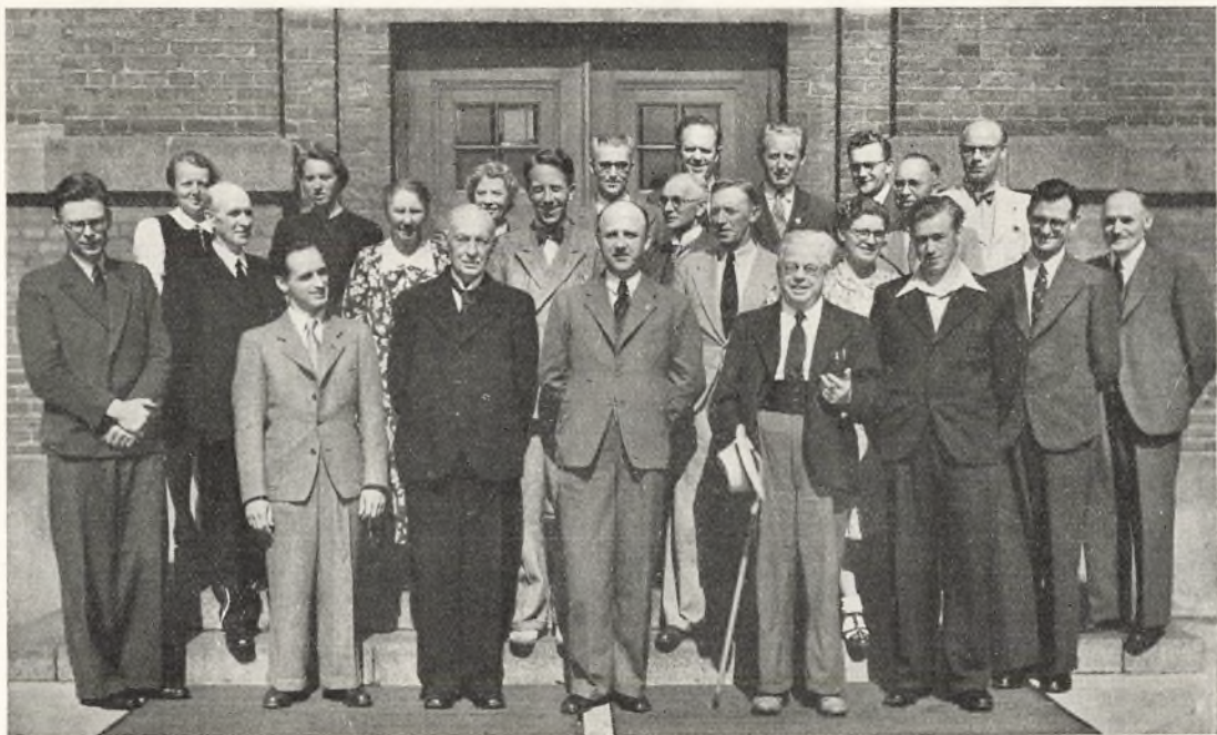
Gymnasiets Lærerkollegium Juni 1943