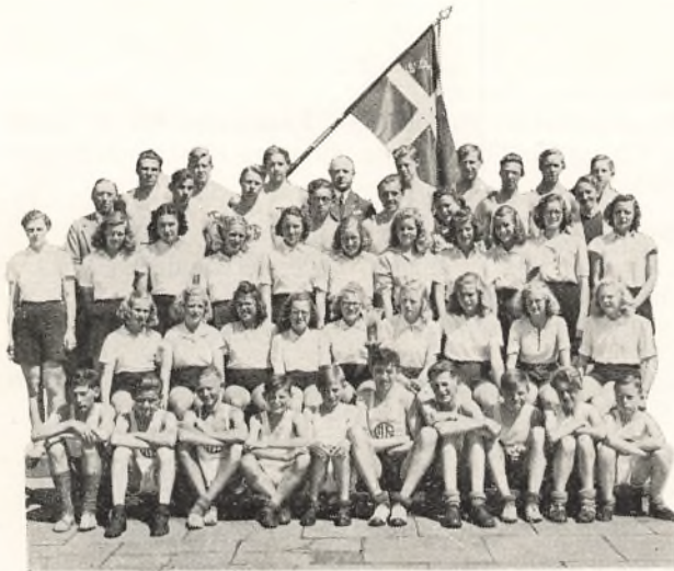
Gymnasiet's Idrætshold 1943