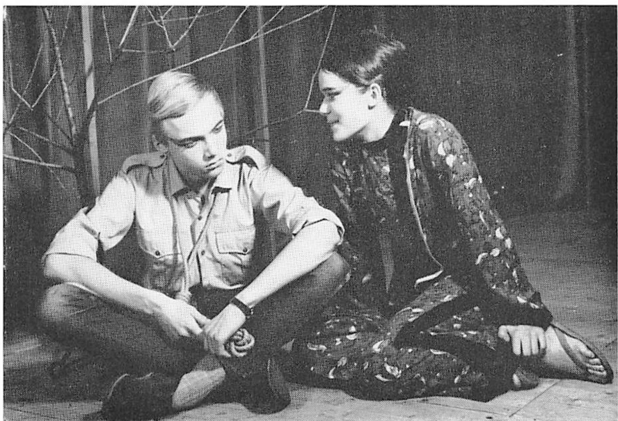
Skolekomedien 1968 — Bertolt Brecht: Det gode menneske fra Sezuan