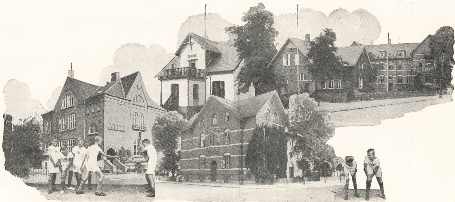
Foroven (fra venstre): Annexbygningen (Samlingerne og Sløjdlokale), Forstanderbolig og den gamle Skolebygning (set fra Hammersholtvej). Forneden: Den nye Skolebygning og den gamle Skolebygning (set fra Gaden).