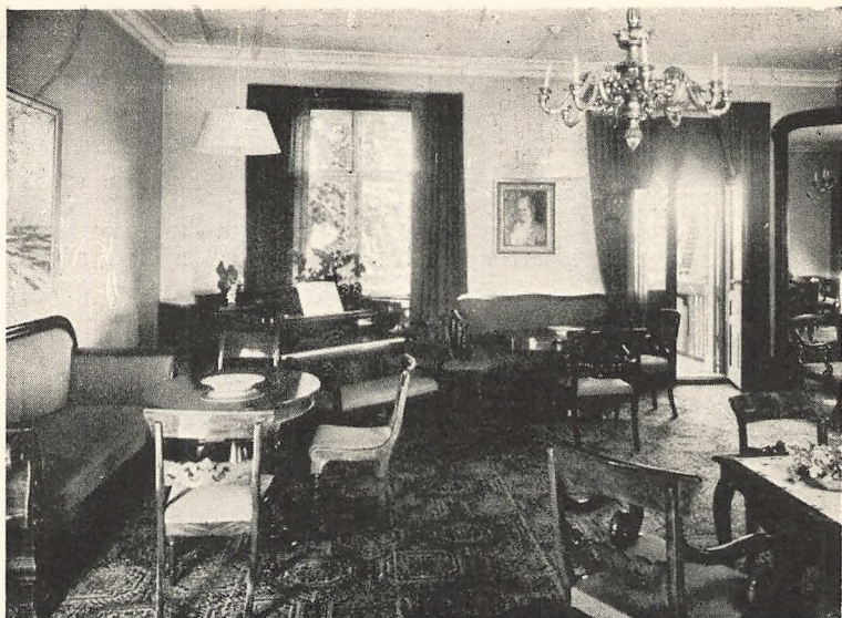
Hjørne af dagligstuen

tes med elevernes øvrige »udlæg« — til bøger, udflugter, nødvendige reparationer o. l. — på specificeret regnskab, der tilsendes ca. hveranden måned + 2 pct. til regnskabsføreren.