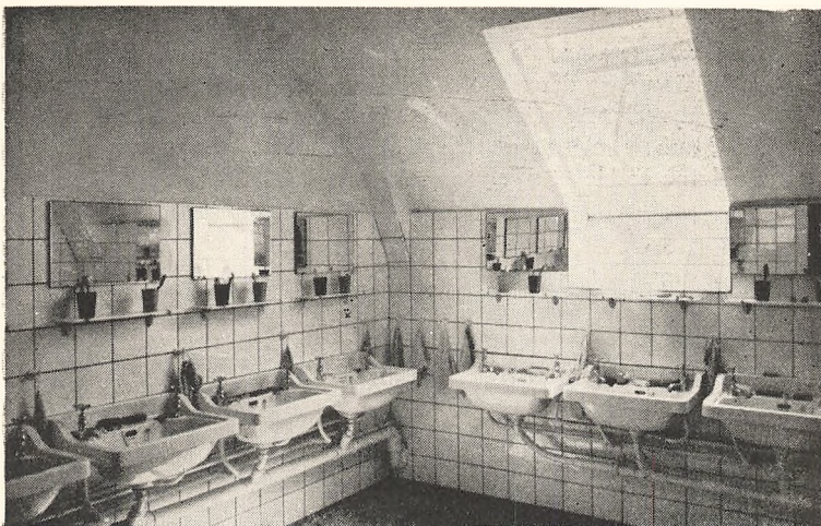
Vaskerum for de store elever