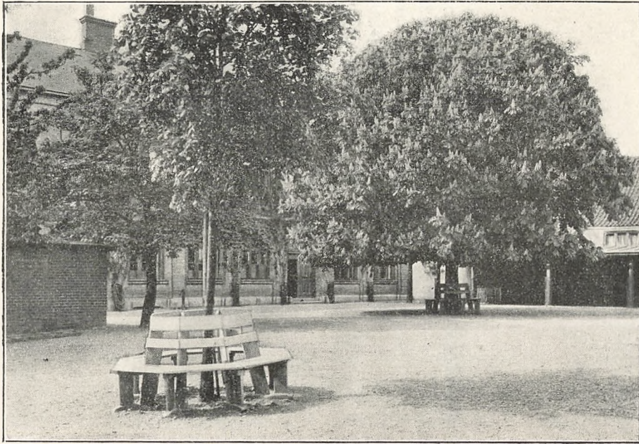
Skolegården ved Foraarstid.