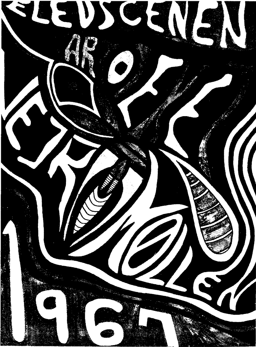
Vinderplakaten ved konkurrencen i forbindelse med skolekomedien.