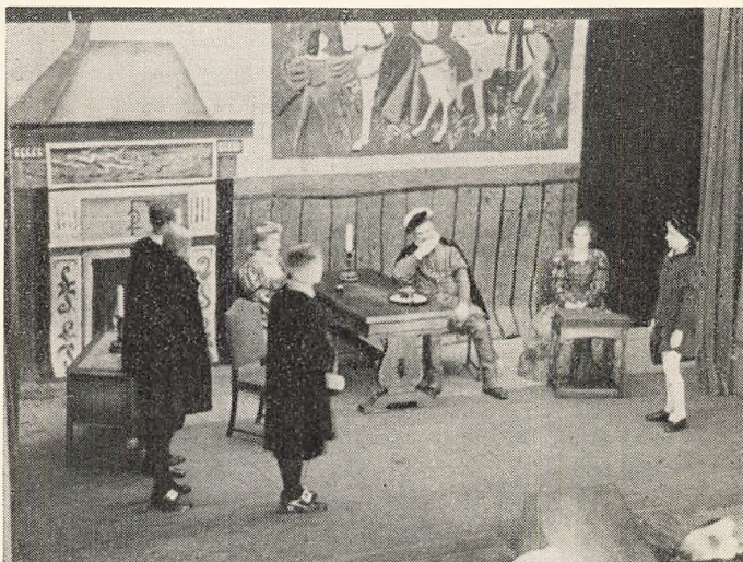
Paa Antvorskov Slot. Anno 1585.

11/11 løb det smukke Festspil af Stabelen til Fordel for Slagelse h. Almenskoles Legatfond. Skuespillet,